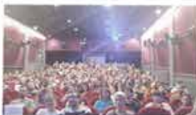
20th One World International Human Rights Documentary Film Festival Prague, Czech Republic / March 5-14, 2018