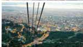
5º Festival Internacional de Cine por Los Derechos Humanos Bogota, Colombia / August 10-16, 2018 (Honorable Mention Jury Prize)