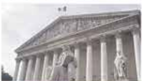
National Assembly of the French Republic Paris, France / July 5, 2018