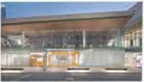
29th New York Human Rights Watch Film Festival New York New York City, USA / June 14-21, 2018