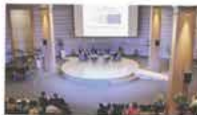
European Parliament One World Brussels, Belgium / April 25, 2018