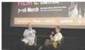
21st London Human Rights Watch Film Festival London London, UK / March 7-16, 2018