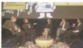
18th Movies That Matter Festival The Hague, Netherlands / March 24-31, 2018