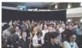
11th Lichter Filmfest Frankfurt International Frankfurt, Germany / April 5, 2018 (Winner Audience Award Best Film)