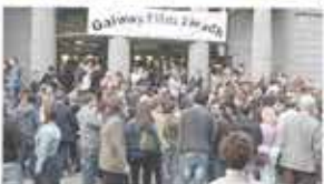
30th Galway Film Fleadh Galway, Ireland / July 10-15, 2018 (Winner Best Human Rights Feature)