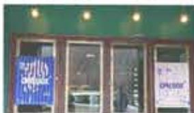
15th CPH:DOX Copenhagen International Documentary Festival Copenhagen, Denmark / March 15-23, 2018