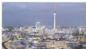
Human Rights Film Festival Berlin, Germany / September 20-26, 2018