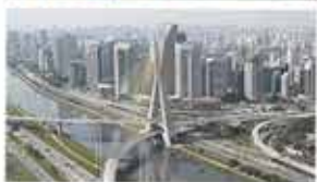
13th Festival de Cinema Latino-Americano São Paulo, Brazil / July 25 - August 1, 2018