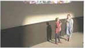
15th Hot Docs Canadian International Documentary Film Festival Toronto, Canada / April 25 - May 5, 2018