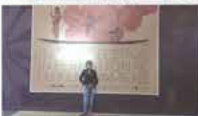
37º Festival International Du Film D'Amiens Amiens, France / Novembre 10-18, 2017