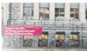
16th Festival du Film et Forum International sur les Droits Humains Geneva, Switzerland / March 9-18, 2018